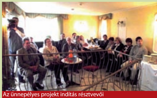
Az ünnepélyes projekt indítás résztvevői