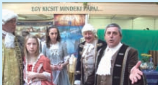
A pápaiak standján korhű jelmezben fogadták az érdeklődőket

A már nem létező Veszprém Megyei Turisztikai Hivatal által „kitalált” és szervezett rendezvény mára az egyik legelismertebb és legnépszerűbb vidéki turisztikai kiállítássá nőtte ki magát. Az ország egyik legjelentősebb vidéki turisztikai kiállításán Magyarország szinte minden régiójának turisztikai kínálata megtalálható volt. S miután a kiállítást és kísérőrendezvényeit ezúttal is díjtalanul látogathatták meg az érdeklődők, nem csoda, hogy a számuk meghaladta a hétezeret. A megyeszékhely lakosságának tükrében ez legalább 10 százalékos látogatottságot jelent, amellyel a Veszprém megyei az egyik leglátogatottabb vidéki Utazás Kiállításnak tekinthető. Idén a megye testvérkapcsolatai közül Szlovákia és Székelyföld képviseltette magát, valamint Ciprus és Málta is jelen volt a rendezvényen. A látogatókat a bejáratnál a kiállítás nyereményjátékának szórólapjával várták, amelynek kitöltői között a szerencsések többek között egy 100.000-Ft értékű utazási utalvánnyal, valamint egy Garda-tavi kempingben tölthető nyaralási lehetőséggel is gazdagodhattak. A rendezvény hagyományainak megfelelően ezúttal is teljes családi programot kínáltak a látogatóknak. A gyerekeket játszóház, ugráló vár és arcfestés is várta, míg a felnőtteket bor és népi ételek kóstolója. Újdonság volt, hogy a kisvonat a belvároson kívül a város legújabb turisztikai látványosságát, a felújított Séd-völgyet is útba ejtette.