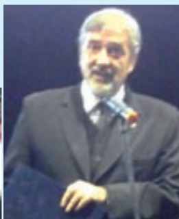
Halász János államtitkár

Egy 1211-es datálású tihanyi okirat említi először Füred nevét – tudhattuk meg a település két jubileumáról megemlékező ünnepségsorozatának egyik eseményén, a képviselő-testület áprilisi eleji ünnepi ülésén.