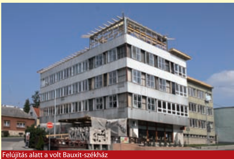
Felújítás alatt a volt Bauxit-székház

Az első pályázati fordulóra Tapolca Város Önkormányzata, mint a projekt gazdája készítette el Tapolca Város Integrált Városfejlesztési Stratégiáját, valamint a Belváros Előzetes Akcióterületi Tervét, amit a Regionális Operatív Programok Irányító Hatósága 2009. február 4-én támogatásra érdemesnek, és további fejlesztésre alkalmasnak talált. Ezzel lehetővé vált a fejlesztés részleteinek kidolgozása, a szükséges tervezői munka elvégzése, amihez a projektgazda ekkor még nem részesült támogatásban – az előkészítési költségek csak a végleges döntés után váltak elszámolhatóvá. Az egyéves projektfejlesztési folyamat eredményeképp elkészült a Végleges Belvárosi Akcióterületi Terv, valamint a közel ezer oldalas pályázati dokumentáció, melyet Tapolca Város Önkormányzata 2010. február 3-án a 2. forduló keretében nyújtott be elbírálásra. A pályázat 2010. március 26-án került befogadásra, s megkezdődhetett a bíráló bizottsági értékelés folyamata.