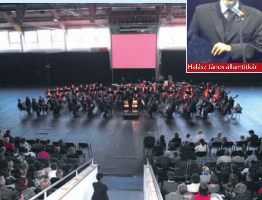
A budafoki szimfonikusok tolmácsolják a népszerű filmek zenéjét