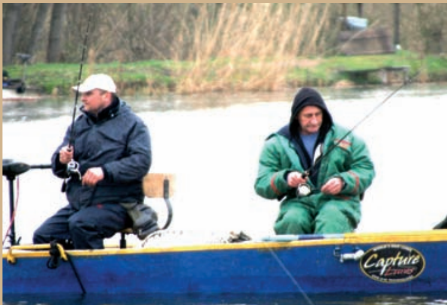
A megszállott horgászként ismert Reviczky Gábor színész (jobb oldalt) is részt vett a versenyen