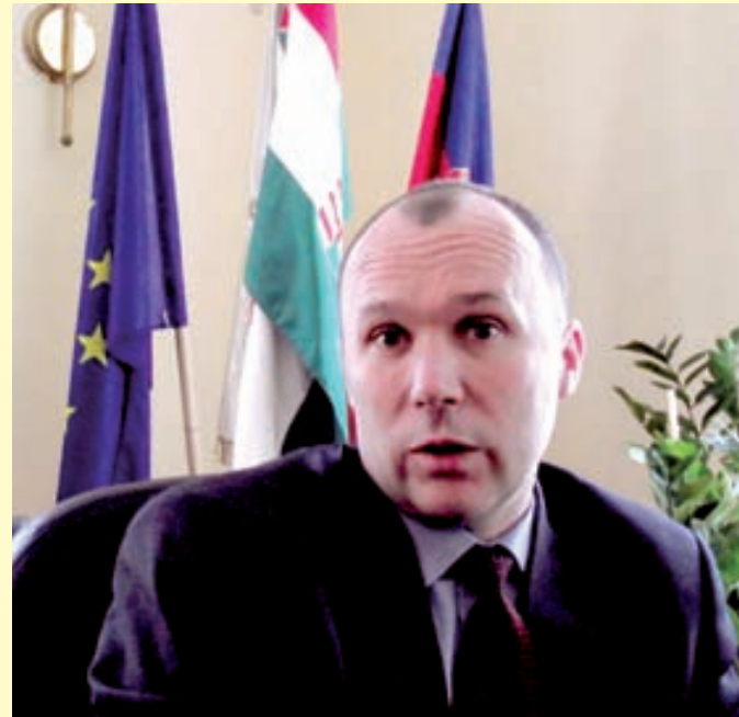
Porga Gyula polgármester

- Azt szoktam mondani: idegenforgalom abban a városban lehet sikeres, ahol a városlakók szeretik a városukat. A veszprémiek nagyon szeretik a városukat, így azokat is, akik kíváncsiak a megyeszékhelyre. Természetesen a nagyobb vendégforgalom idején elkerülhetetlenek az időkénti konfliktusok. Az utcazene fesztivál idején, amikor tízezrek lépik el a belvárost, az ott lakók ezt, főként a kezdetekben, szóvá tették. De minden esetben kezelni tudtuk e gondot. Miként azt az autóforgalmat is, amit az állatkertet évente felkereső 250-300 ezer látogató okoz. Így nyugodt szívvel mondhatom: Veszprém vendégváró, vendégszerető város.