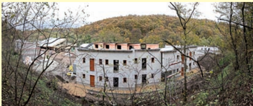
Épülőben a Malomvölgy Centrum

- Nem tagadom, hogy kedvező fogadtatás esetén, szeretnénk ezt a pályázatot több önkormányzati épületre kiterjeszteni. Gondolok itt az óvodára és iskolára, valamint a futballpályához tartozó öltözőre. Nyilvánvalóan ehhez elő kell teremniünk a megfelelő önrészt, mely biztosított a mostani költségvetésből.