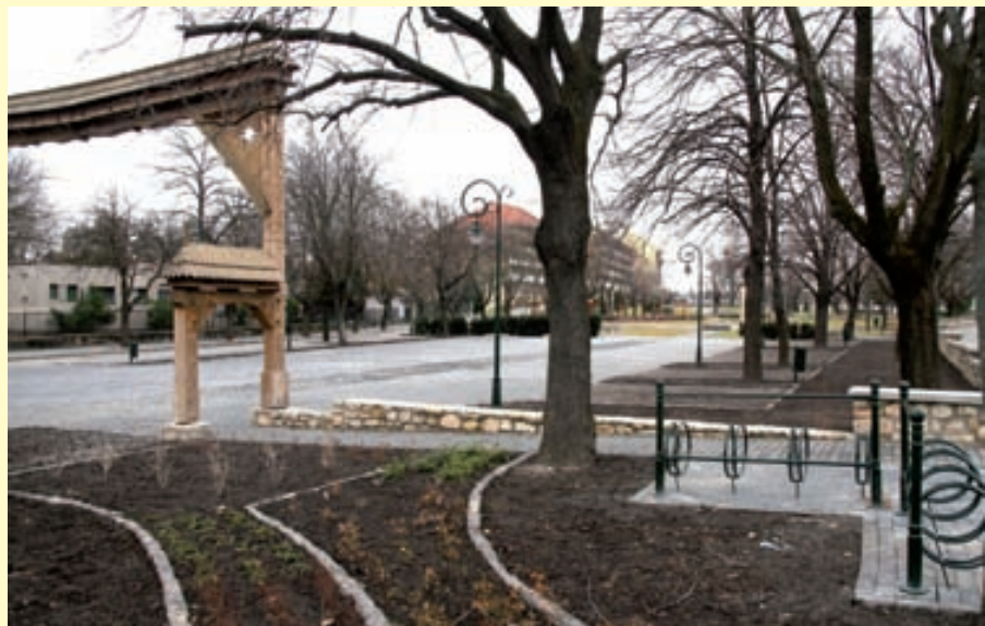
Megújult a Köztársaság tér

A projekt központi pontja a Fő tér körül összpontosul, amely érinti a Fő tér–Deák Ferenc utca kelet-nyugati kereskedelmi vonalát, valamint az észak-déli kulturális-rekreációs tengelyt: Tapolca-patak, Malom-tó, Tamási Áron Művelődési Központ, Köztársaság tér. A beruházások összességében hozzájárulnak ahhoz, hogy a belváros – mint a legtöbb funkcióval ren-