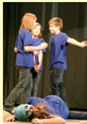
Jeleskedtek a siófoki gyerekek