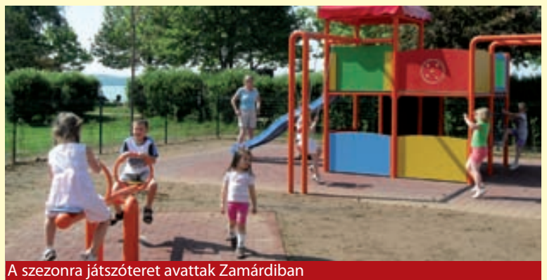
A szezonra játszóteret avattak Zamárdiban