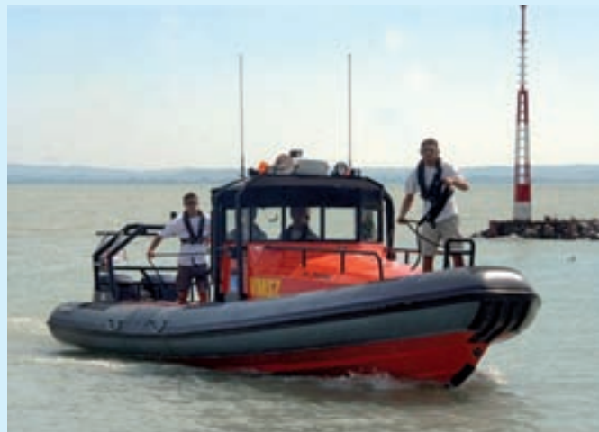
Rupert – a sürgősségi mentőhajó