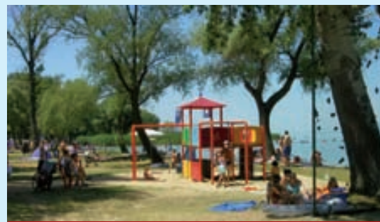
Játszóter a strandon