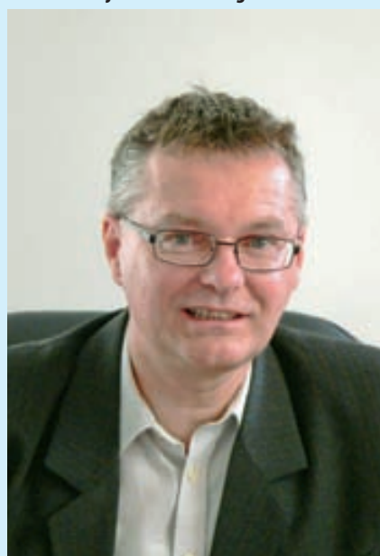
Miklós Tamás polgármester

Pályázati támogatás nélkül, önerőből, hatékony és költségkímélő megoldásokat alkalmazva folyamatosan megszépülnek és kiépülnek a révfülöp strandok. Az önkormányzat által felvett 20 milliós forintos fejlesztési hitelből jövőre is marad még fejlesztésre, s remélik a településen, hogy a bevétel-növekedés kitermeli a környezet további felújításának költségeit is.