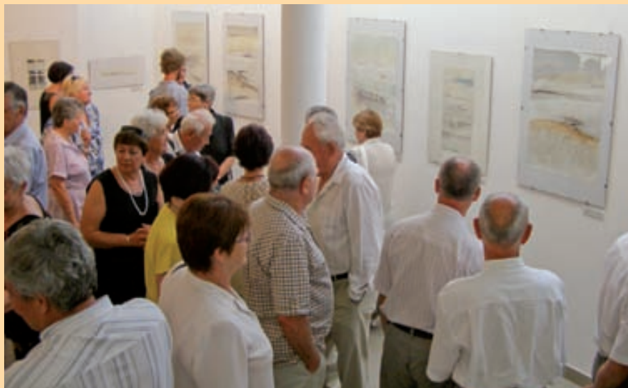
A tárlat vendégei

A város múzeumának történelmében igen régen fordulhatott elő, hogy kiszoruljanak a tágas udvarra a résztvevők. Most így történt, bár az is igaz, hogy Egry halálának 60. évfordulóján a program része volt a festő mellszobrának megkoszorúzása is. Veszeli Lajosnak nem kis gondot okozhatott a válogatás: egyrészt volt miből, másrészt valamiképp alkalmazkodnia is kellett a hely szelleméhez, melynek éppúgy része a káprázatos fény-árny játék, mint érzékeny lelkének pillanatnyi rezdülései. Előbbi a vásznonról üzen, utóbbi a művész lényéből.