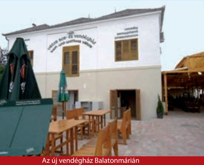
Az új vendégház Balatonmárián

A család meghatározó szerepe, a vállalkozások európai modellje jelenik meg abban a beruházásban, melynek felépítéséhez érkezünk a létesítmény ünnepélyes átadásával - ezekkel a szavakkal köszöntötte Gelencsér Attila, Somogy megye Közgyűlésének elnöke a bala-tonmáriai Viktor Bor- és Vendégház avatásán résztvevő vendégeket.