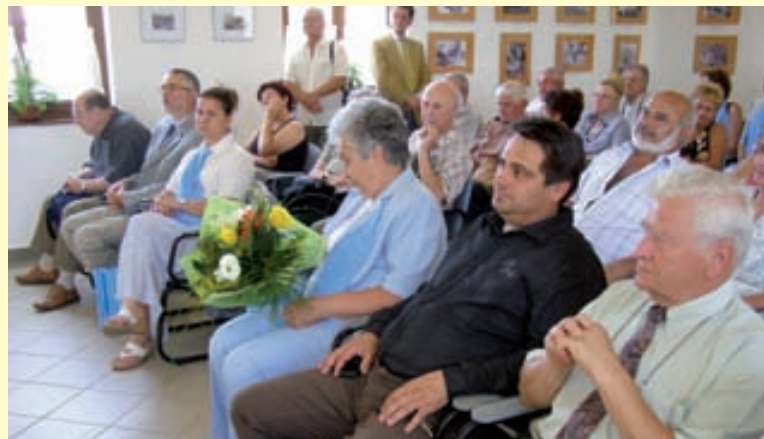
Az ünnepi megemlékezés vendégei

Annak dacára, hogy a Szépkilátó alatti részen római fürdő is működött az ókorban, a település fürdő-kultúrájának újkori felvirágzására az 1880-as filoxéravész utáni esztendőig kellett várni – mondta Tar Ferenc történész az ünnepségen elhangzott előadásában. Abban az időben – mikor még a halászsok sem nagyon tudtak úszni – kellett elgondolkodni azon, hogy a halászsaton és borászaton kívül mi biztosíthatna még megélhetést a helyieknek. A Balaton évszázadokig állt kihasználatlanul, az első – mára feledésbe merült – fürdő a Zánka melletti Vérkúton működött, Balatonfüreden pedig nem a tó, hanem a savanyúforrás gyógyvizében fürdöztek. A 19. század második felétől azonban fokozatosan kialakult az a középmező, mely megengedhette magának, hogy üdülni menjen. A folyamat a déli, majd az északi vasút kiépülésével felgyorsult, a parton megjelentek a nyaralók, villák, üdülők. 1911-ben pedig az elsőként megalakult a Balatongyöröki Fürdőegyesület.