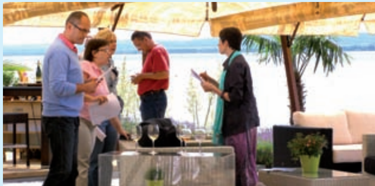
Adás előtti pillanatkép a révfülpői nyári stúdióból

Révfülöpről jelentkezik június közepétől a Magyar Televízió Balatoni nyár című színes, információs magazinja. A stáb a móló mellett rendezte be stúdióját, ahol bárki testközelből megláthatja az ott folyó munkát.