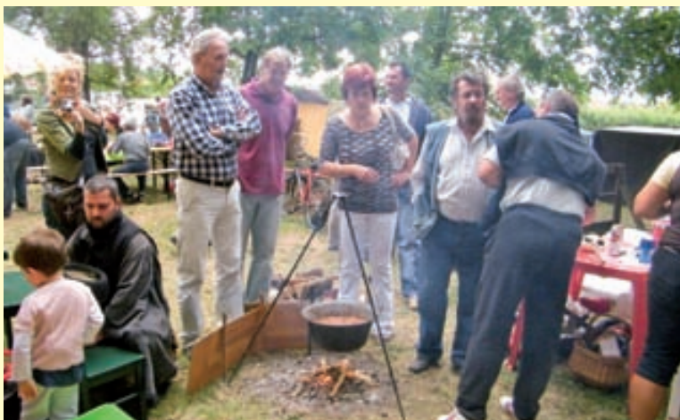
Munkában a zsűri