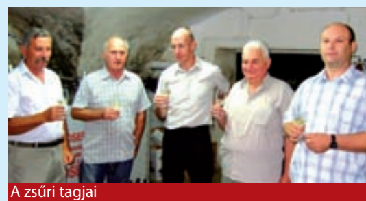
A zsűri tagjai

A Badacsonyi Szőlészeti és Borászati Kutatóintézet pincéjében vette kezdetét a Veszprém Vármegye Bora megmérettetés előzsűrízése június utolsó hetében. A kiténtető címe a hegyközségi borversenyek aranyérmes borai közül huszonhárom bortermelő harminchat borral nevezett a versenyre.