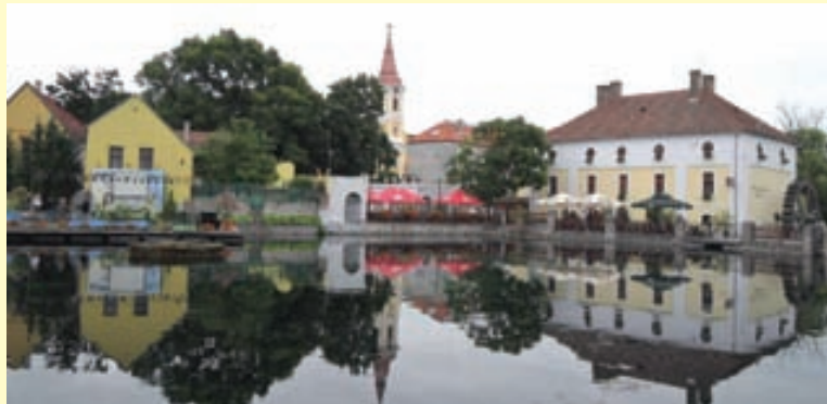
A népszerű Malom-tó