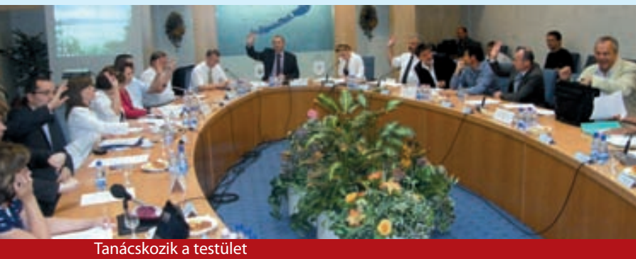
Tanácskozik a testület

A tárca államtitkára a koncepciót a területi közigazgatás történelmi léptékű átalakításának minősítette, melynek kidolgozása és bevezetése nem tűr halasztást. Érzékeltetésül elmondta: a jegyzők jelenleg négyezer feladat végrehajtásáért felelősek. Sürgető szükségesség tehát ezen a gyakorlaton változtatni – ki kell dolgozni azt a hatékony formációt, amely rögzíti, milyen hivatali rendszer és állami szerepvállalás szükséges a feladatok optimális végrehajtásához. Megtudhattuk, hogy az átszervezés évek óta napirenden van, ám a megszorítások, létszámleépítések általában az apparátus felső szintjét érintették – lejjebb gyakran pazarlást észlelhetettek az állampolgárok, miközben nem lehetett tudni, érdemben hol intézik ügyeiket. Ezen a gyakorlaton kíván változtatni a kormányzat azzal az intézkedéssel, hogy 2013 végén már általánossá váljék az egyablakos ügyintézés. Az államtitkár szólt arról is, hogy akkreditált képzéssel segítik a dolgozók felkészítését.