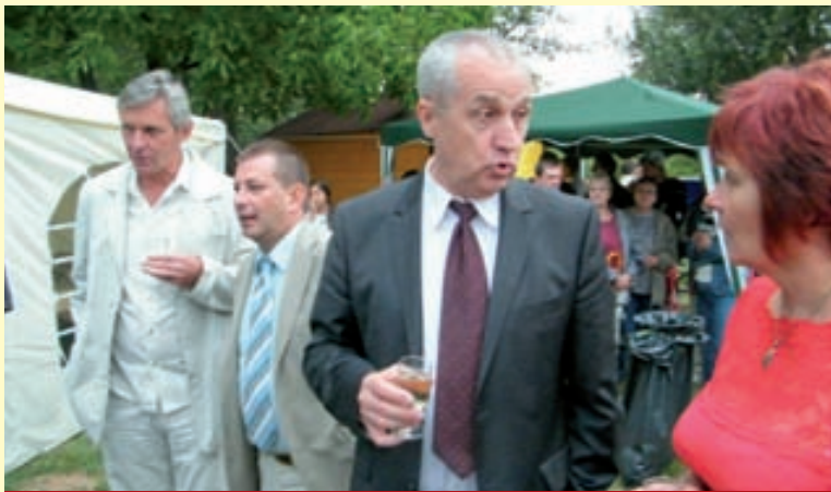
Az előtérben Konrátrát Károly államtitkár

Az idei lovasi falunapokat Konrátrát Károly államtitkár nyitotta meg. Ünnepi beszédében kiemelte, hogy a hagyományörző településre mindig szívesen jön, mert ahol összetartó emberek élnek, az a falu jövőjét szolgálja.