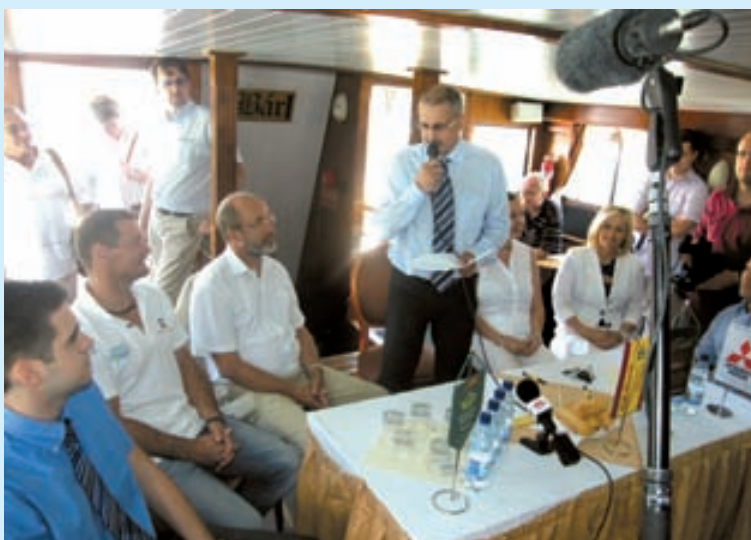
A sajtótájékoztató előadó

Amikor a szervezők a sajtótájékoztatót tartották, örömmel jelentették be, hogy az idén a korábbiaknál jóval előbb, már július 2-án megrendezik a hagyományos Balaton-átúszást Révfülp és Balatonboglár között. A Kelén motoros hajó fedélzete zsúfolásig megtelt a sajtó képviselőivel, akik örömmel adtak hírt arról, hogy az idén – a tavalyival ellentétben – nem maradhat el az úszás. Nem hát, hiszen a rendezők kedvezőtlen időjárás esetére az egész hónap során több tartalék napot is megjelöltek: július 3. (vasárnap),