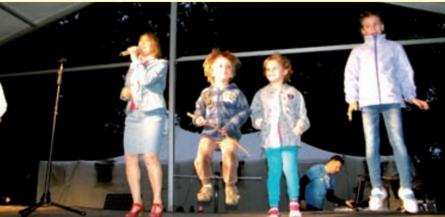
Kovács Kati és a gyerekek

A balatonfüredi Acro Dance csoport látványos rock and roll showja jó alapot adott Kovács Kati koncertjéhez, aki közvetlenségével sok embernek a szimpátiáját elnyerte. A Búgócsiga együttes fergeteges utcabájlán fiatal és idős egyaránt ropta a talpalávalót. Másnap főzőversenyyel indult a falunap, ahol tí-