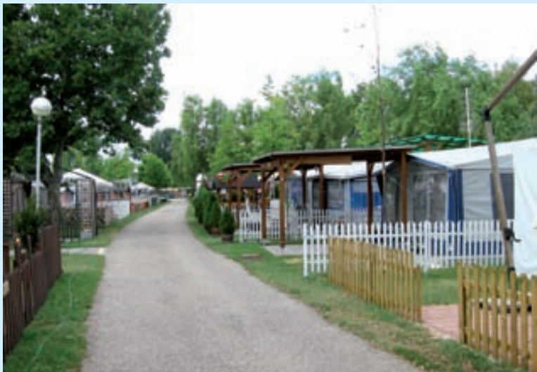
Az önkormányzati kemping egy részlete

Bármilyen hihetetlen, szinte a május eleji nyitástól kezdve sorban állnak a leendő bérlők a Riviéra Kemping helyeiért, és ez várhatóan „telt házat” jelent szeptember végéig – mondja Hebling Zsolt, Alsóörs polgármestere. Aki fontosnak tartja azt is hangsúlyozni, hogy viszontagságos előtörténet után az önkormányzat valójában 2005-től került birtokon belülre a kemping másfél hektáros területén.