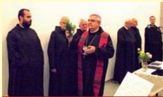
A látogatóközpontot Várszegi Asztrik pannonhalmi főapát áldotta meg

A folytonosság és az elődök tevékenységének elismerésével újabb turisztikai, illetve szolgáltató létesítményt avattak Tihanyban. A Tihanyi Bencés Apátság látogatóközpontjának megépítéséhez ugyanis a korábbi kormányzati ciklus illetékes szervezetei és személyiségei