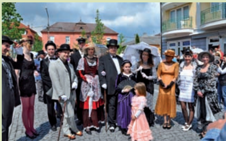
A Boldog békeidők Hévíze nyitotta a nagyrendezvények sorát – a városvezetés is jelmezt öltött

- Ezek egy része már meg is valósult; a nagyrendezvények sorát a Boldog békeidők Hévíze programsor nyitotta, mely egészen egyedi fesztivált jelentett itt, de országos viszonylatban is. Korhű öltözékekkel, jelmezes felvonulással, koncertekkel szórakoztatta Hévíz a közönséget. De nemcsak ez a rendezvény váltott ki országos visszhangot: nemrég fejeződött be a Hévízi Vakáció egyhetes programsora, melyen – az országban először, elsőként – egy napig a várost vezető diákpolgármestert is választottak, s maga mögött tudhat a város egy ugyancsak sikeres, a Szent Iván-éji szokásokhoz kapcsolódó fesztivált is. Amit fontos kiemelni: a város minden nagyrendezvénye díjmentesen látogatható.